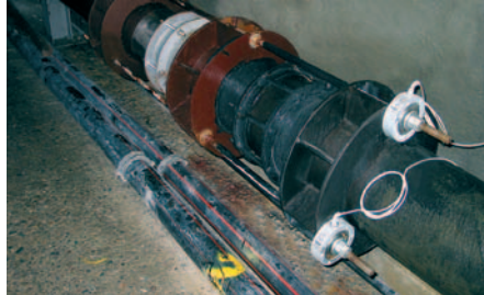
Zugkraftmessung Stollen Langenegg