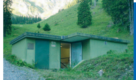
Sammelbrunnstube / Ausgleichsbecken Blattenheid

Pelton-turbine (eindüsig) Nenngefällebrutto 576 m Ausbauwassermenge 8000 Liter/Minute Leistung 646 kW Wirkungsgrad 87 bis 90% Länge Druckleitung 2980 m Ø Druckleitung 300 mm