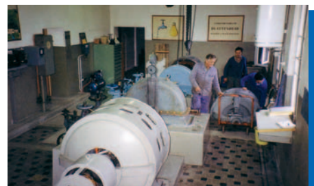
Unterhaltsarbeiten im Maschinenraum