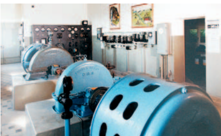
Maschinenraum mit Steuerschrank