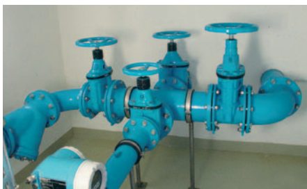
Schieber- und Messschacht