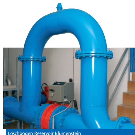
Löschbogen Reservoir Blumenstein