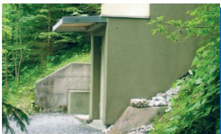
Zugang Reservoir Oberstocken