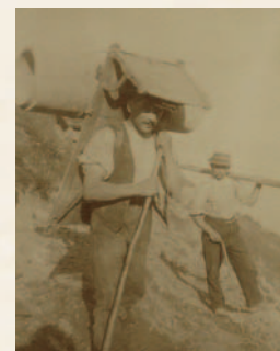
... auf einem Räf

Erstellt 1913 bis 1914 Stollenquerschnitt 1.80 m x 1.35 m Geologie 0 bis 11 m Fels 11 bis 100 m Moräne und Bergsturz (Kies, Steine, Blöcke) Fassungsrohr Steingutröhren Ø 25, 30 cm Zum Schutz der Steingutröhren wurde der ganze Stollen mit Steinen und Blöcken verfüllt. Kosten Ausbrucharbeiten Fr. 9 670.40 Steingutröhren Fr. 2 817.50 Verfüllung Fr. 2 008.50 Total Fr. 14 796.40