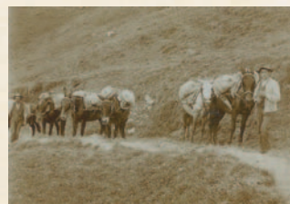
.. mit Maultieren