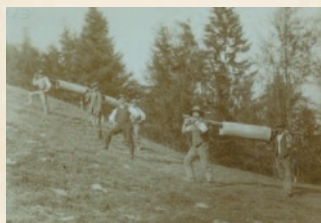
Transporte durch Muskelkraft...