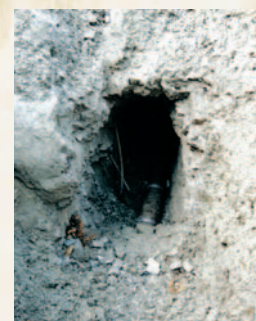
Stolleneingang mit Steingutröhre